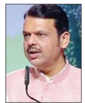
शिंदे पर टिप्पणी मामले में फडणवीस की दो टूक

मुंबई। कॉमेडियन कुणाल कामरा को महाराष्ट्र के उपमुख्यमंत्री एकनाथ शिंदे पर टिप्पणी करना भारी पड़ गया है। उनके खिलाफ पुलिस में प्राथमिकी दर्ज कराई गई है। शिवसैनिकों में आक्रोश है। वहीं महाराष्ट्र के सीएम देवेंद्र फडणवीस ने भी कुणाल कामरा को चेतावनी दी है। सीएम फडणवीस ने कहा कि स्टैंड-अप कॉमेडी करने की आजादी है, लेकिन वह जो चाहे बोल नहीं सकते। महाराष्ट्र की जनता तय कर चुकी है कि गद्दार कौन है। कुणाल कामरा को माफी मांगनी चाहिए। इसे बर्दाश्त नहीं किया जाएगा।